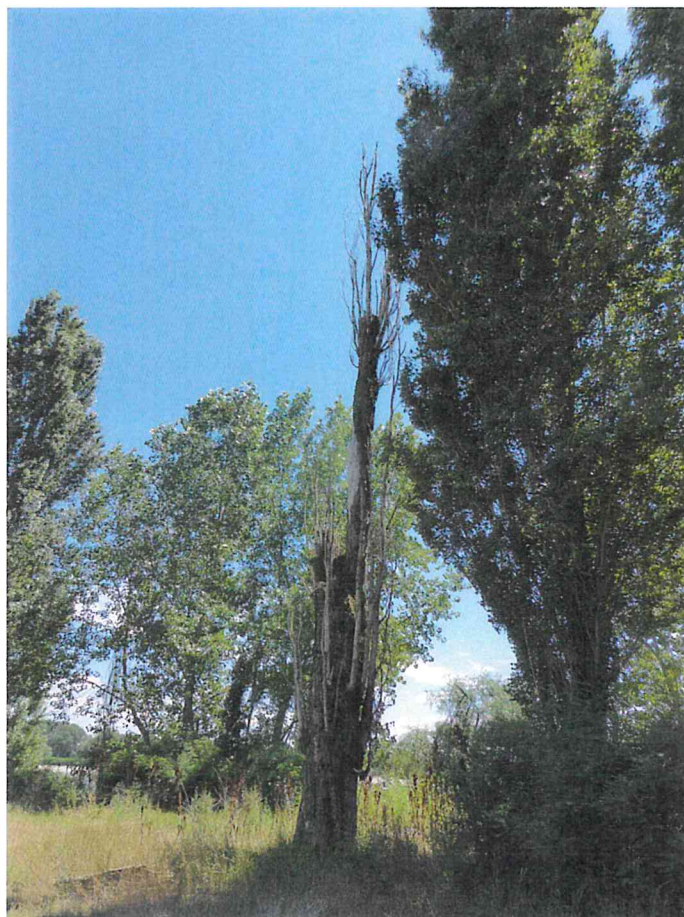
Foto 5: alcune delle piante presenti lungo il filare che saranno rimosse