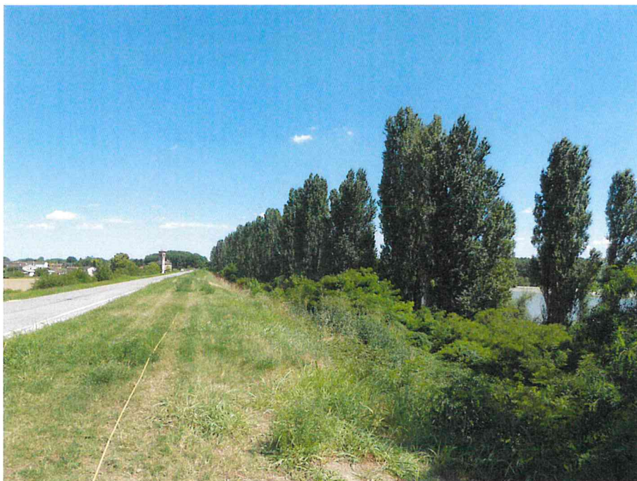
Foto 1: vista generale della zona d'intervento: in primo piano l'argine maestro del fiume Po e la SP. n. 54