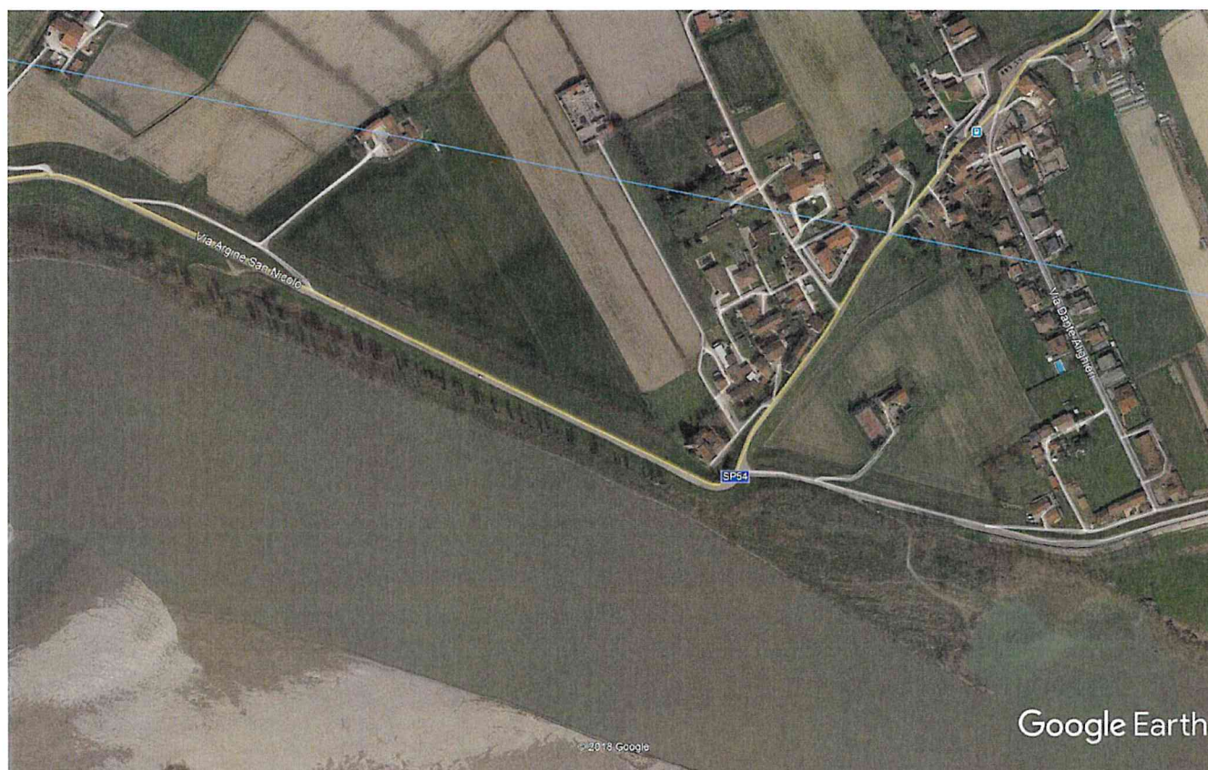
Figura 1: Vista generale della zona d'intervento

(MN-E-38-NI) Intervento prioritario di scala interregionale per la manutenzione morfologica del fiume Po alla curva di regolazione in sinistra dell'alveo di magra n. 9 di Borgoforte località Boccadiganda in comune di Borgo Virgilio (MN).